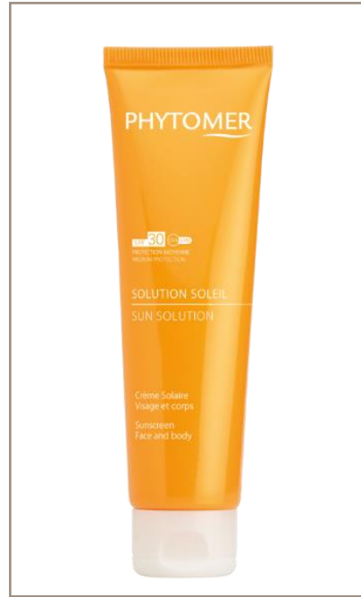
SOLUTION SOLEIL SPF30