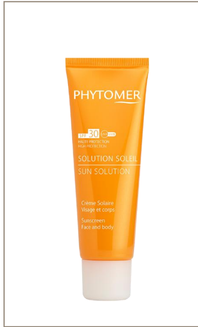
SOLUTION SOLEIL SPF30