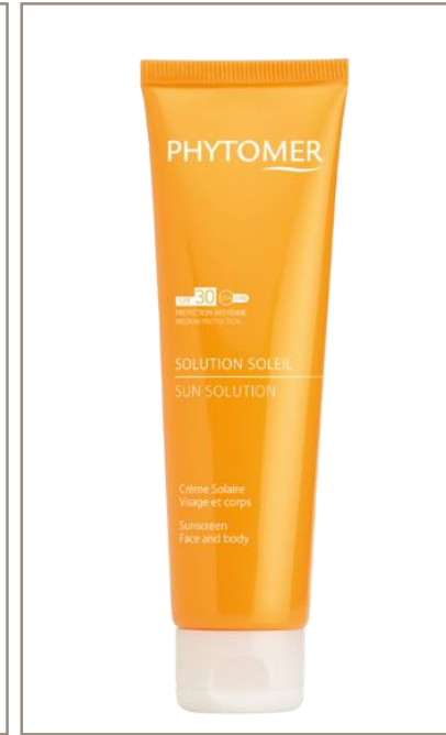
RÉSULTAT SOLEIL Self-Tanning cream