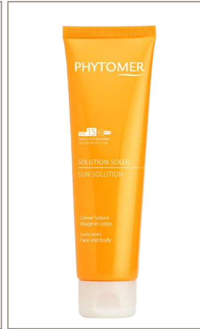
SOLUTION SOLEIL SPF15